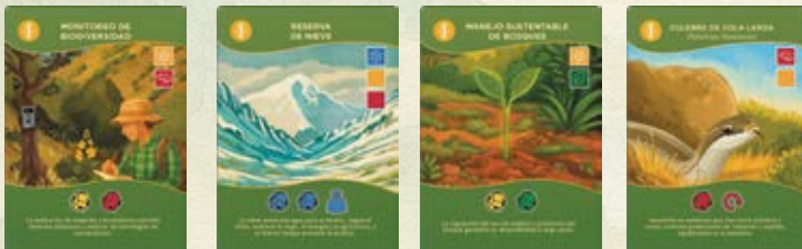
Cartas Nivel 1