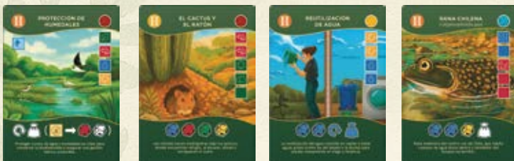
Cartas Nivel 2