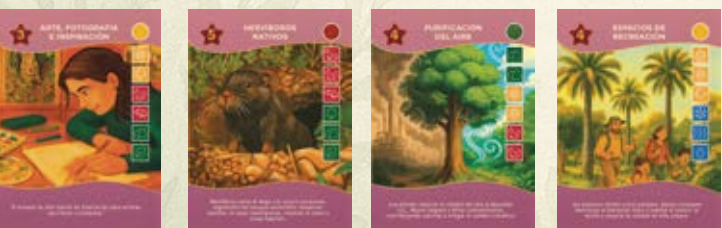
Cartas Objetivo, Puntos de Victoria

2. Gestión de dados: Los dados son los recursos del juego y representan diferentes elementos del ecosistema: plantas, animales, agua y acciones humanas. Los jugadores los lanzan, guardan, giran o gastan para ejecutar acciones, comprar cartas o obtener cartas de Puntos de Victoria.